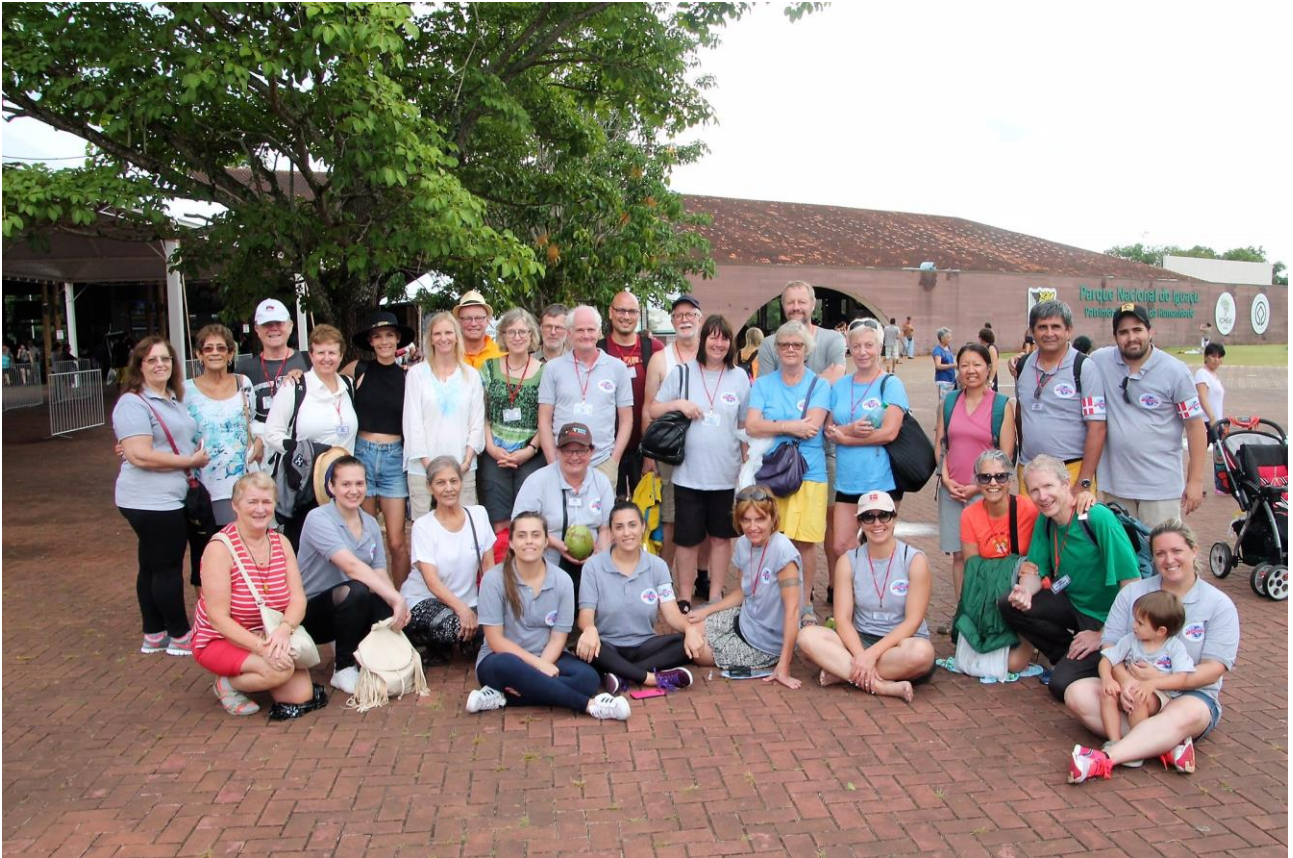
Alle reunionens deltagere efter en fantastisk tur til den brasilianske side af Iguazu Falls, januar 2017.